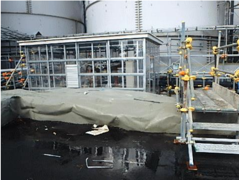
図一3 外周堰から漏れだした汚染水