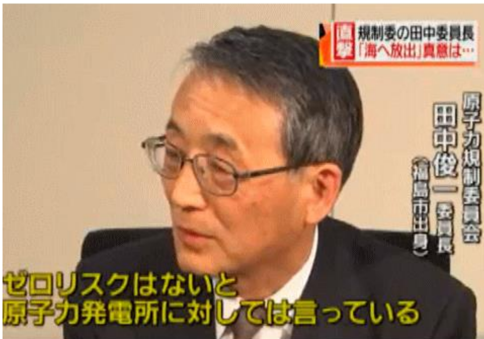
図一6 「ゼロリスクはない」と発言する原子力規制委委員長