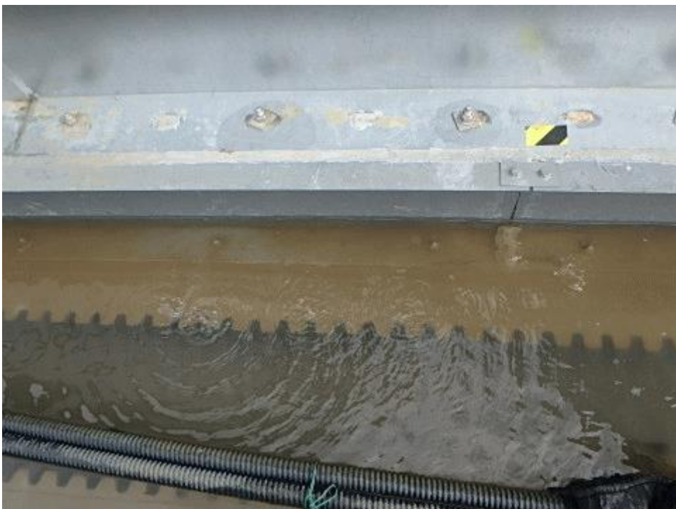
図一4 外周堰の汚染水中の「泡」