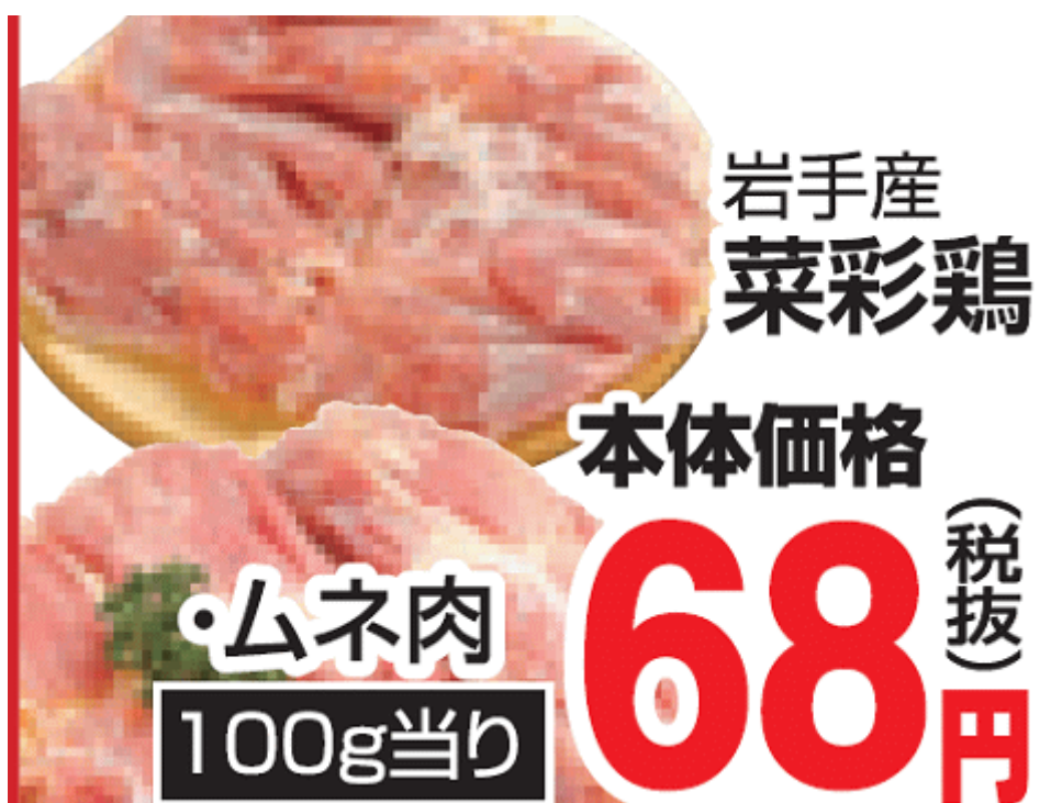
図一七 福島産鶏肉が無い福島県川俣町のスーパーのチラシ