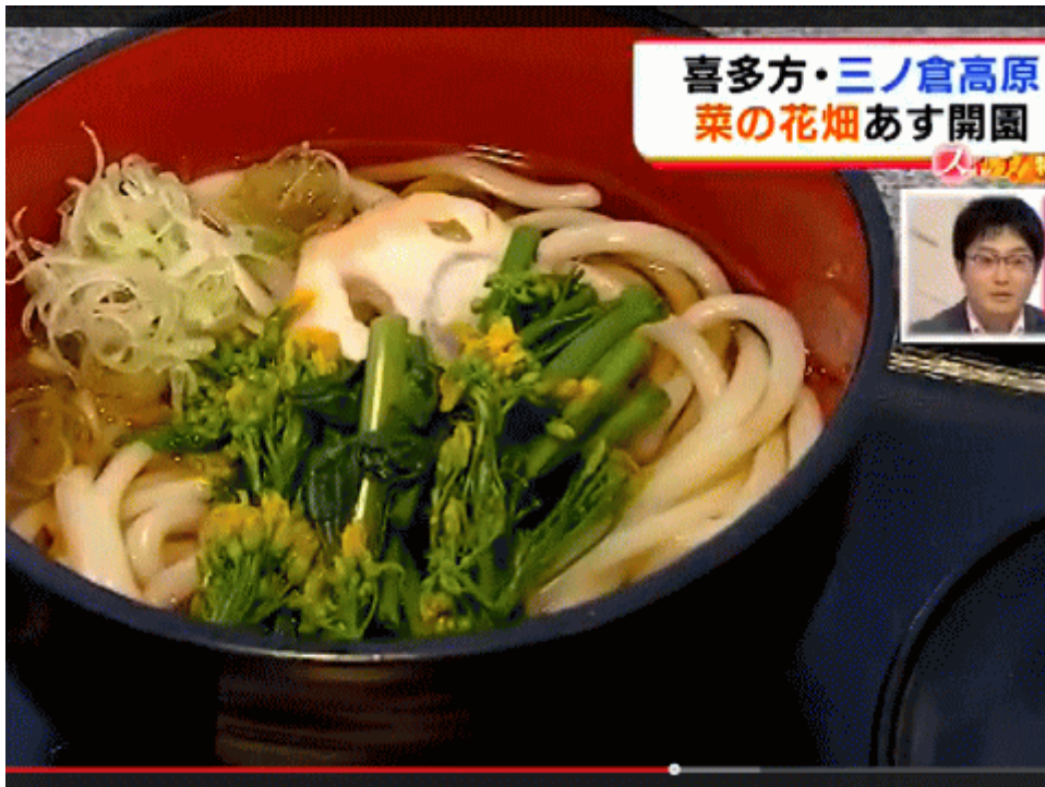
図一3 喜多方市の「おもてなし」に使われる「菜の花料理」