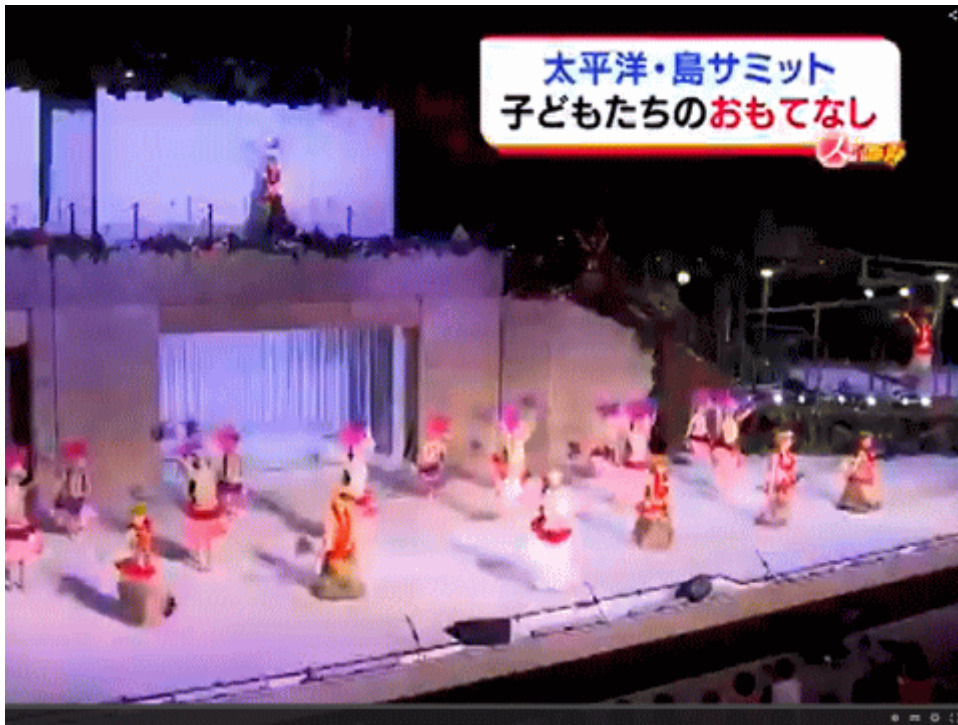
図一9 「島サミット」でポリネシアンショーを演じるフラガールの皆さん。