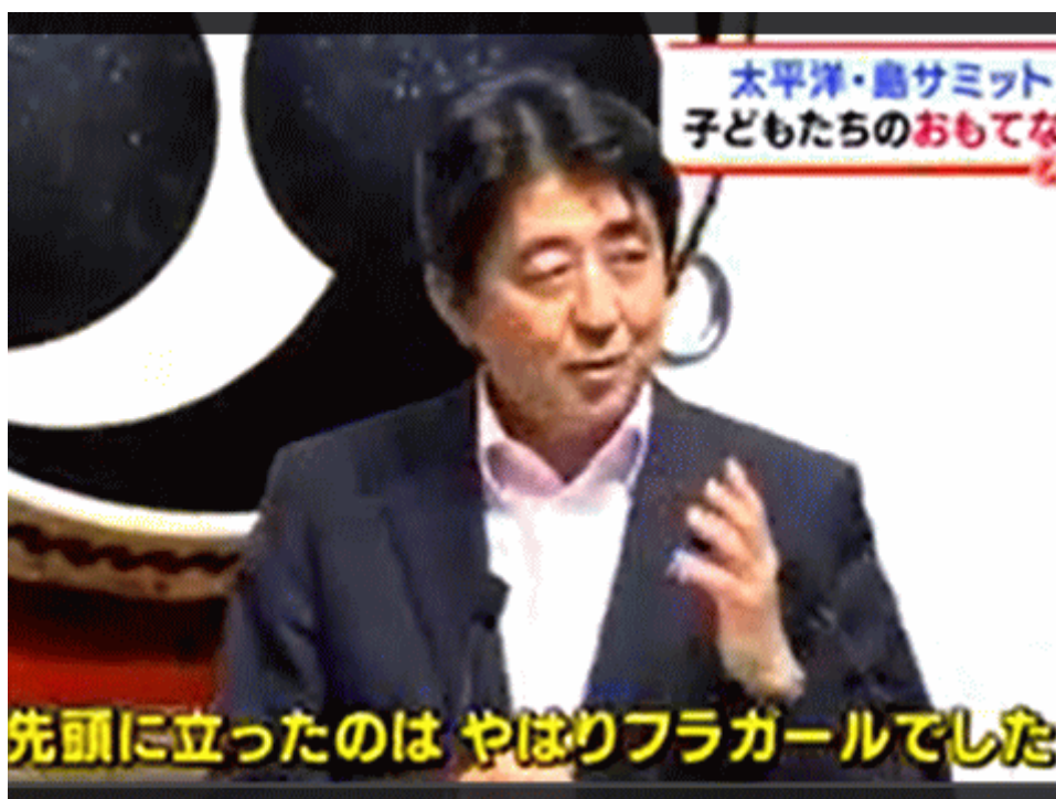
図一八 「先頭に立ったのはやはりフラガールでした」と発言する安倍出戻り総理