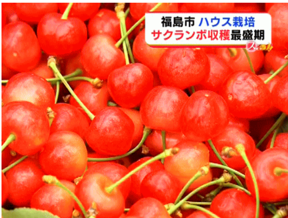
図一4 福島市のハウス栽培の「サクランボ」の収穫が最盛期と報じる福島のローカルTV (TUF)