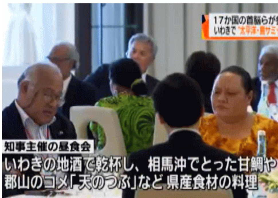
図二 相馬（福島県）沖で採れたアマダイ料理をだした報じる福島のローカルTV局 (FCT)