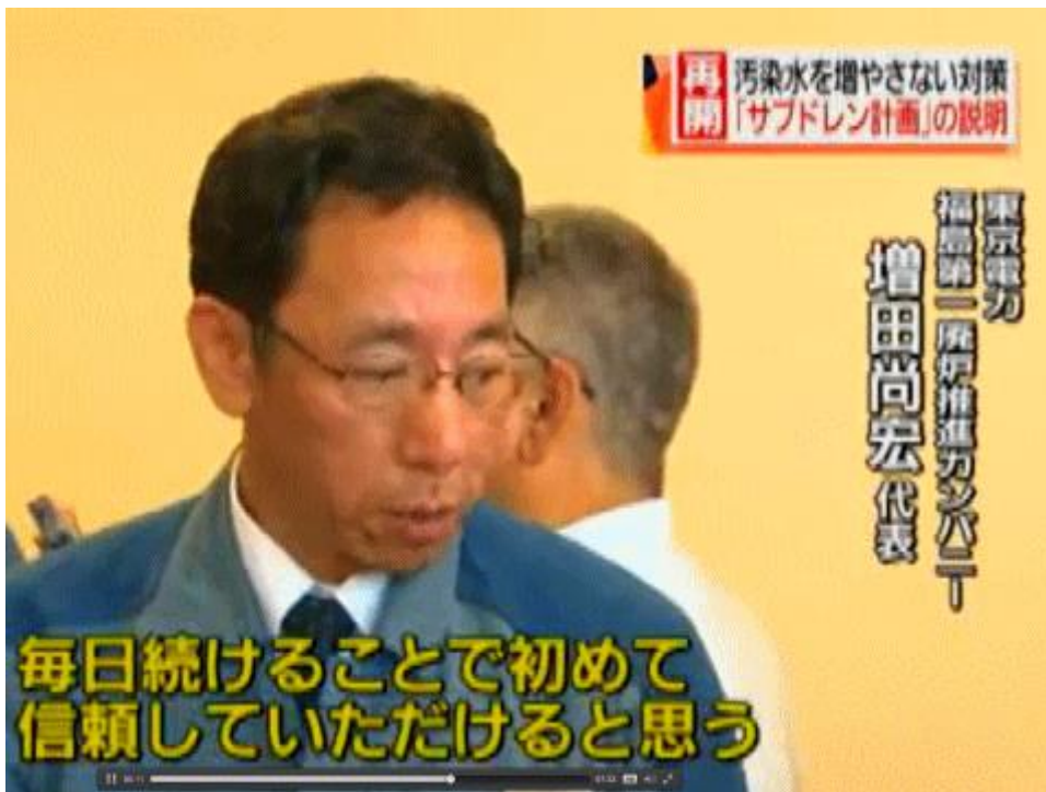
図一3 「毎日続けることで初めて、信頼していただけると思う」と発言する東電責任者