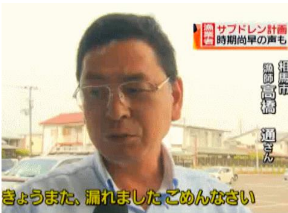
図一4 「今日またもれました ごめんなさい」怒りをあらわにする福島の漁師さん。