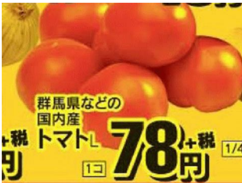
図一3 福島産トマトが無い福島県南会津町のスーパーのチラシ