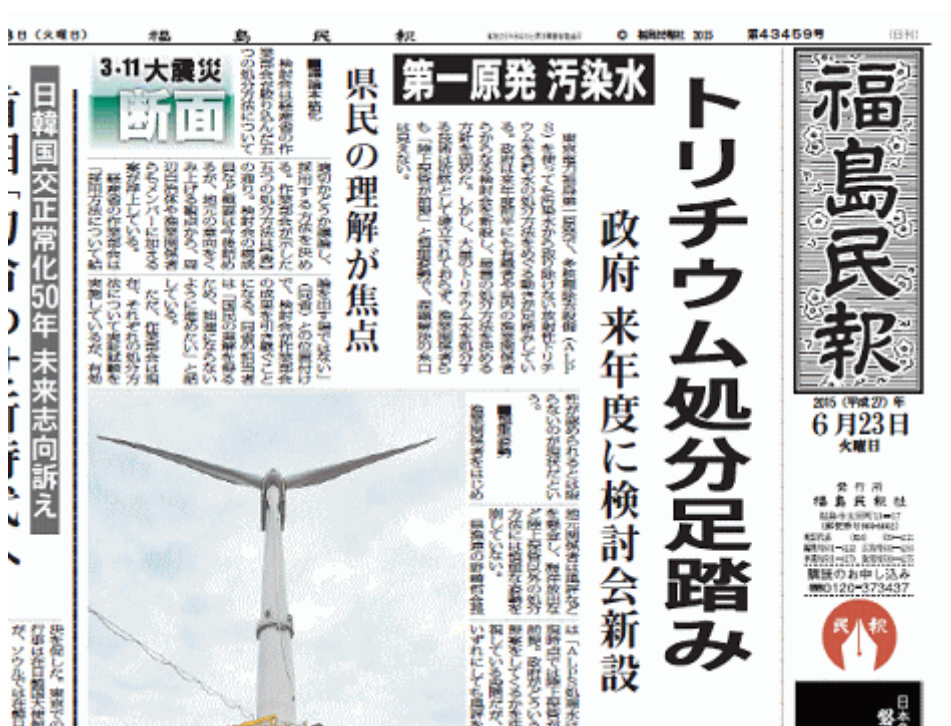
図一1 1面トップで福島第一原発のトリチウムについて伝える福島県の地方紙福島民報（6月22日朝刊）