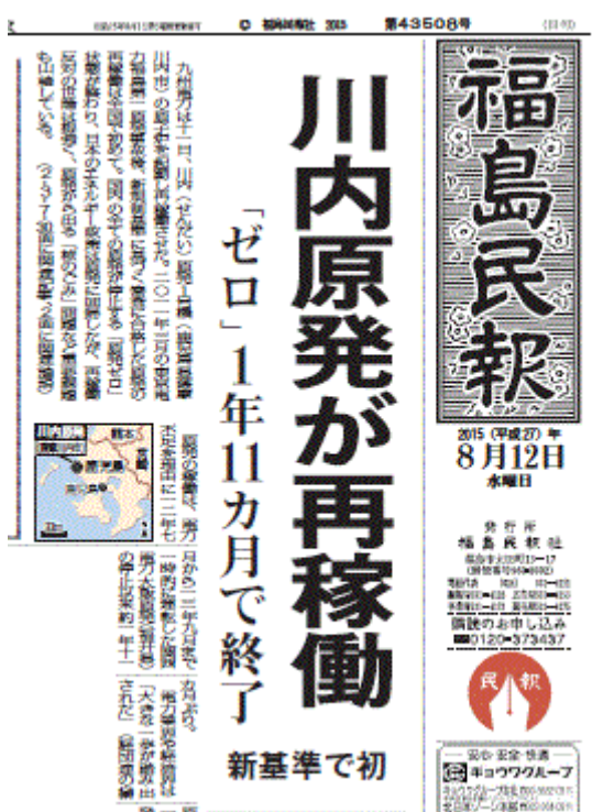
図一4 川内原発再稼働を報じる福島県の地方紙の福島民報