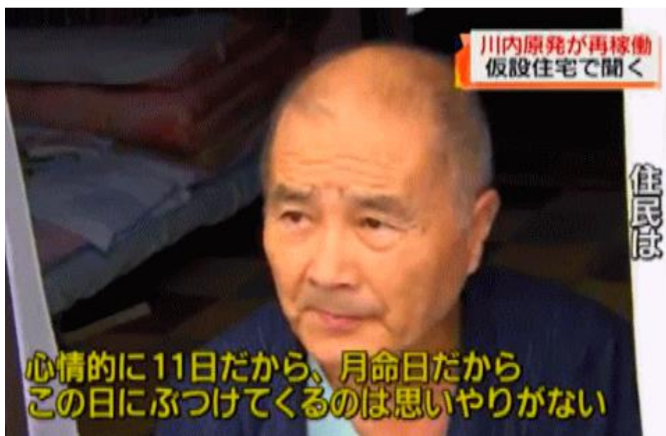
図一5 「(再稼働を) この日(11日)にぶつけてくるとは思いやりがない」と話す原発難民