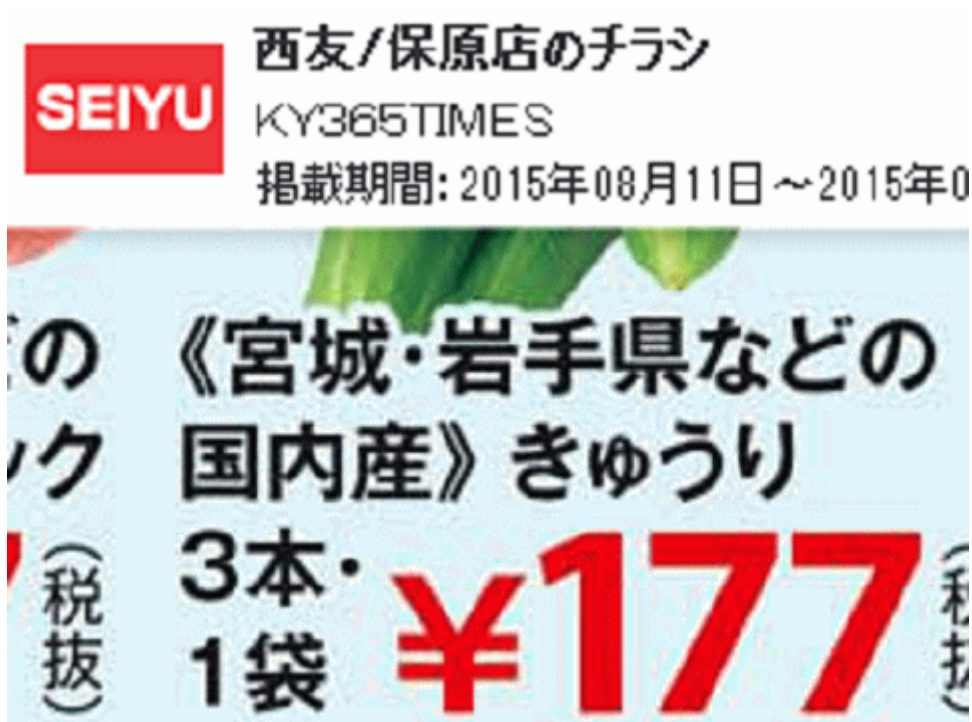
図一6 福島産キュウリが無い福島県伊達市のスーパーのチラシ