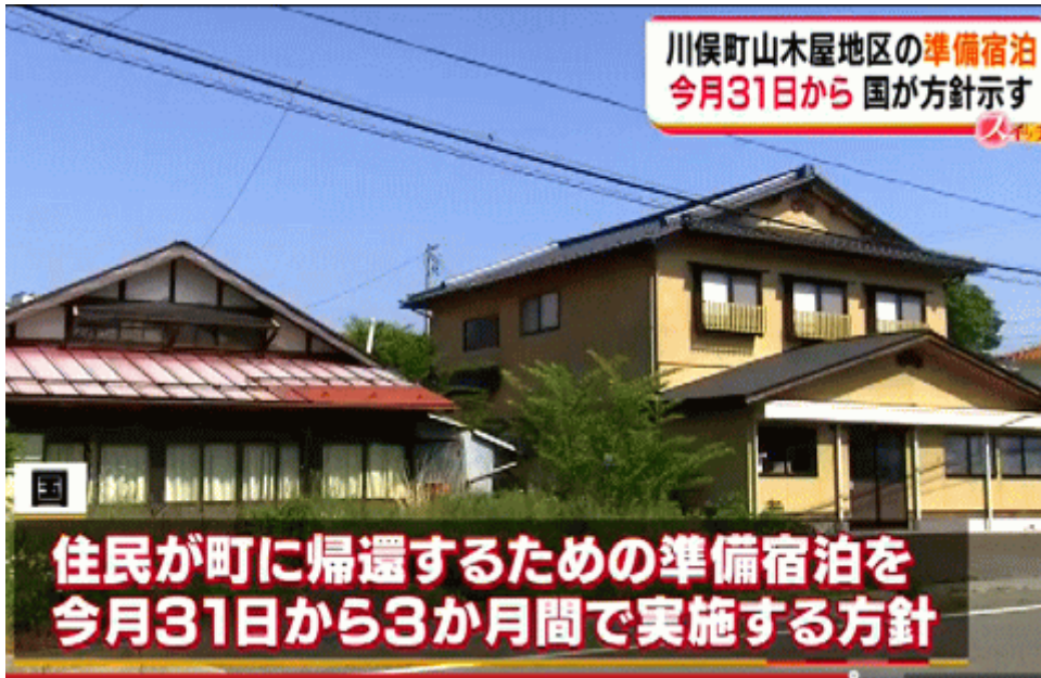
図一3 福島県川俣町の準備宿泊開始決定を伝える福島県のローカルTV局（TUF）