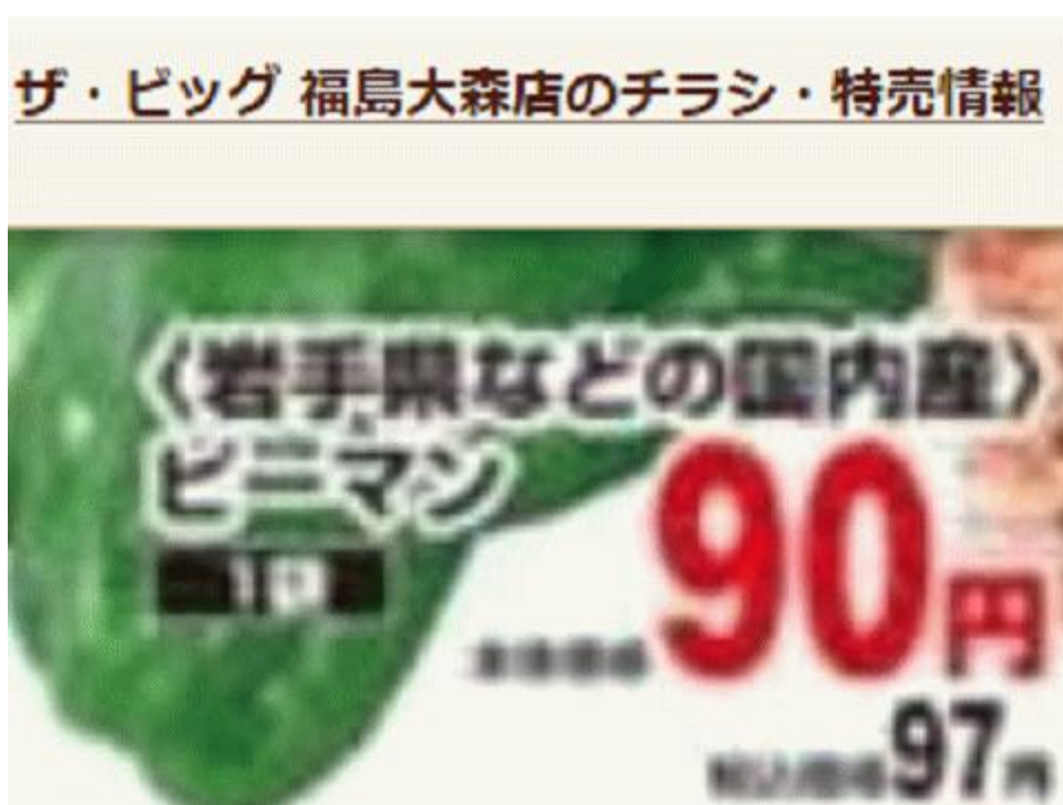
図一4 福島産ピーマンが無い福島県福島市のスーパーのチラシ