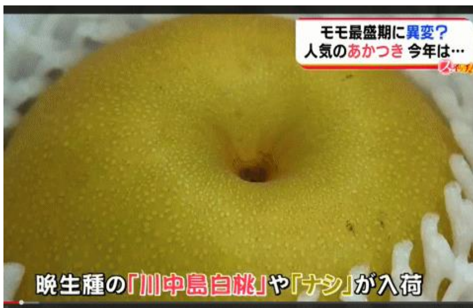
図一3 福島市の直売場にならぶ「ナシ」