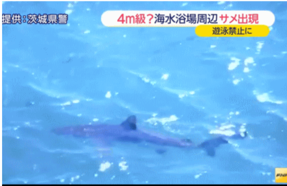
図一5 茨城県沖に現れた鯨