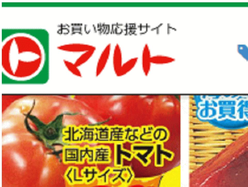
図一6 福島産トマトが無い福島県いわき市のスーパーのチラシ