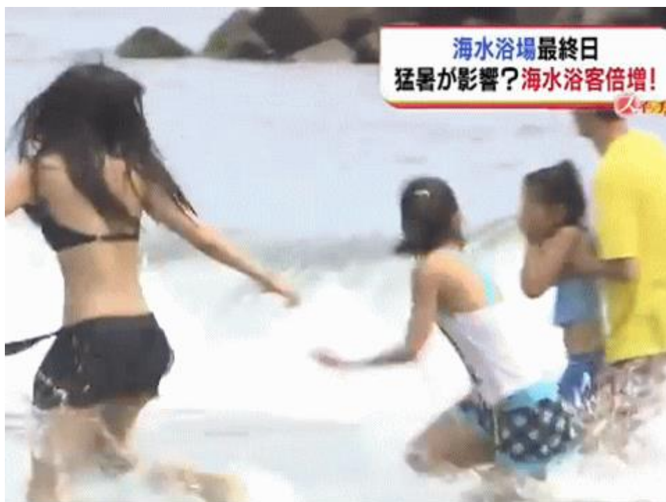
図一1 福島のお海じまいを報じる福島のローカル TV局 (TUF)