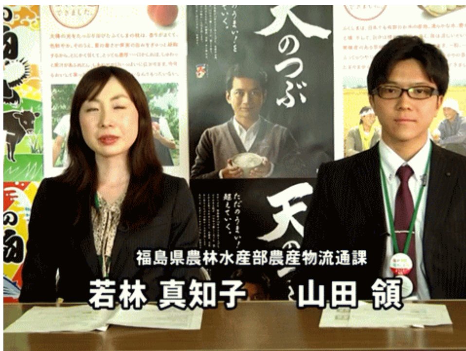
図一 4 福島産は「安全」と強弁する福島の役人