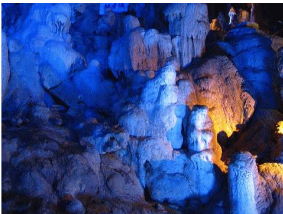
図一1 あぶくま洞内部