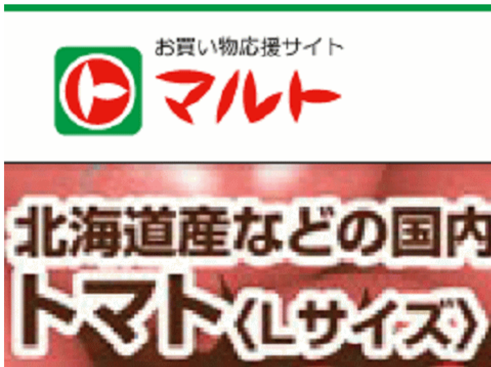
図一5 福島産トマトが無い福島県いわき市のスーパーのチラシ