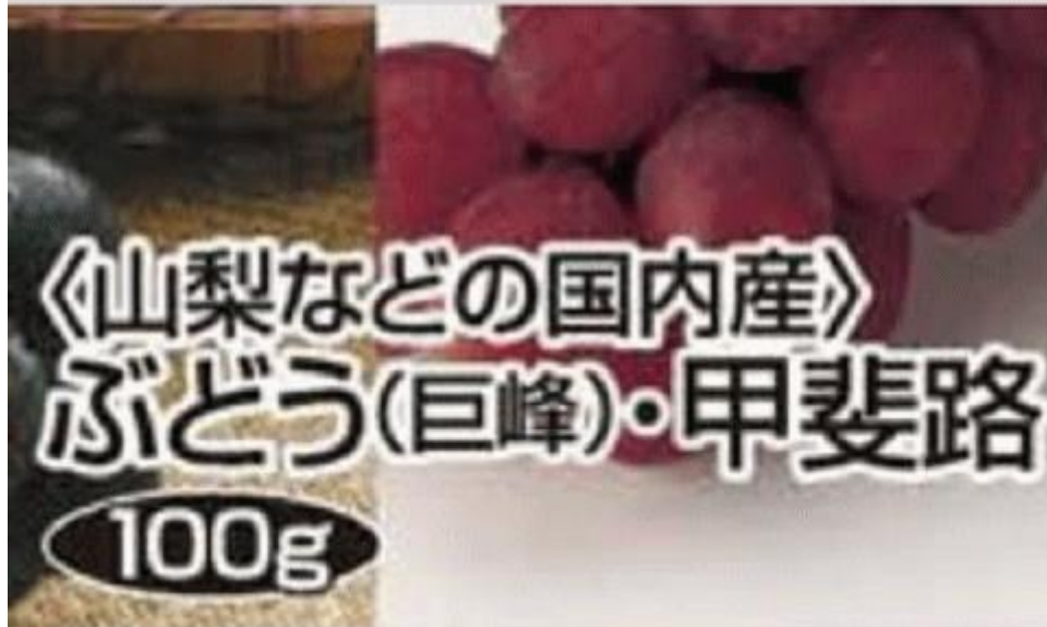
図一 7 福島産が無い福島県二本松市のスーパーのチラシ