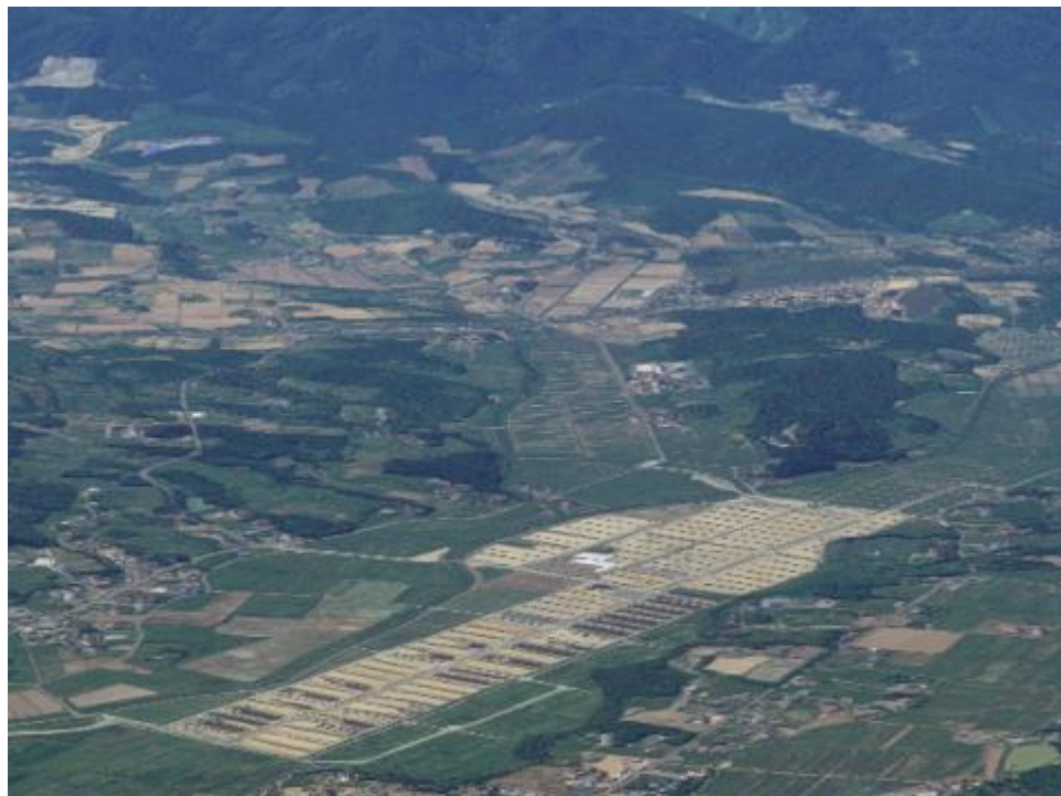
図一2 南相馬市仮置き場