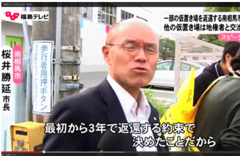
図一 6 仮置き場について話す南相馬市長