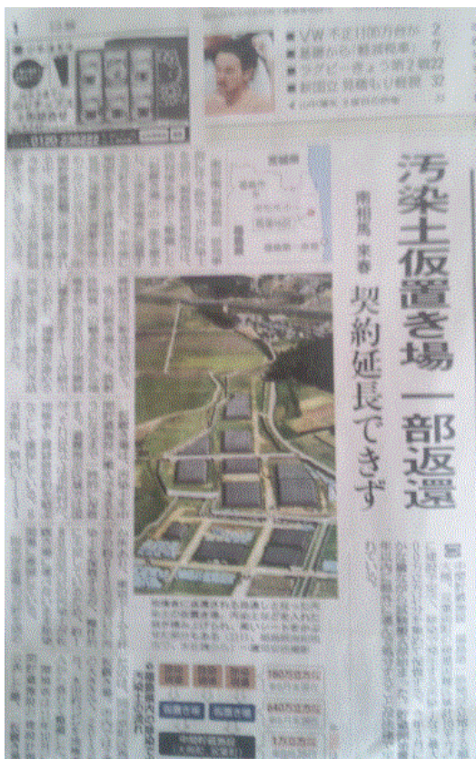
図一4 9月23日の読売新聞一面