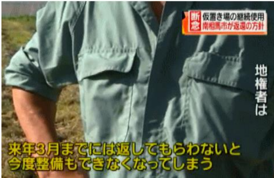
図一 5 仮置き場の借地の延長を拒否した借主