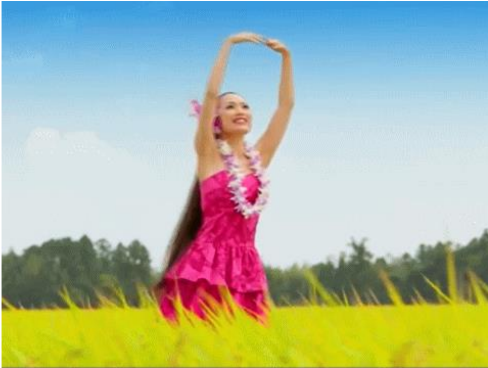
図一2 フラダンスを踊る福島県の綺麗な女性