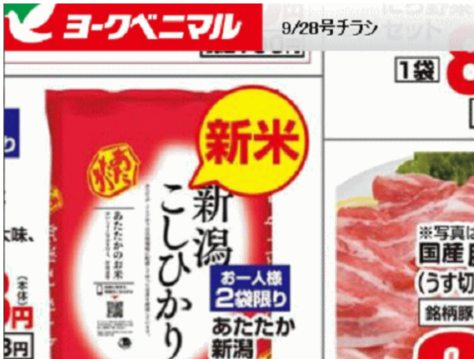
図一4 福島産が無い福島県いわき市のスーパーのチラシ