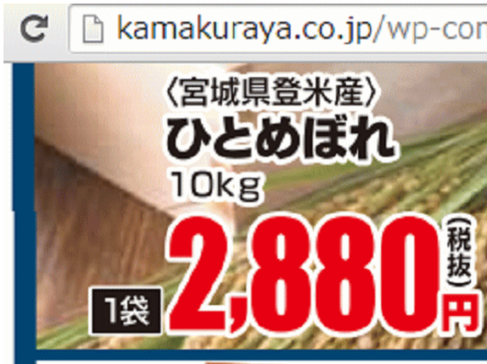
図一 3 福島産米が無い福島県郡山市のスーパーのチラシ