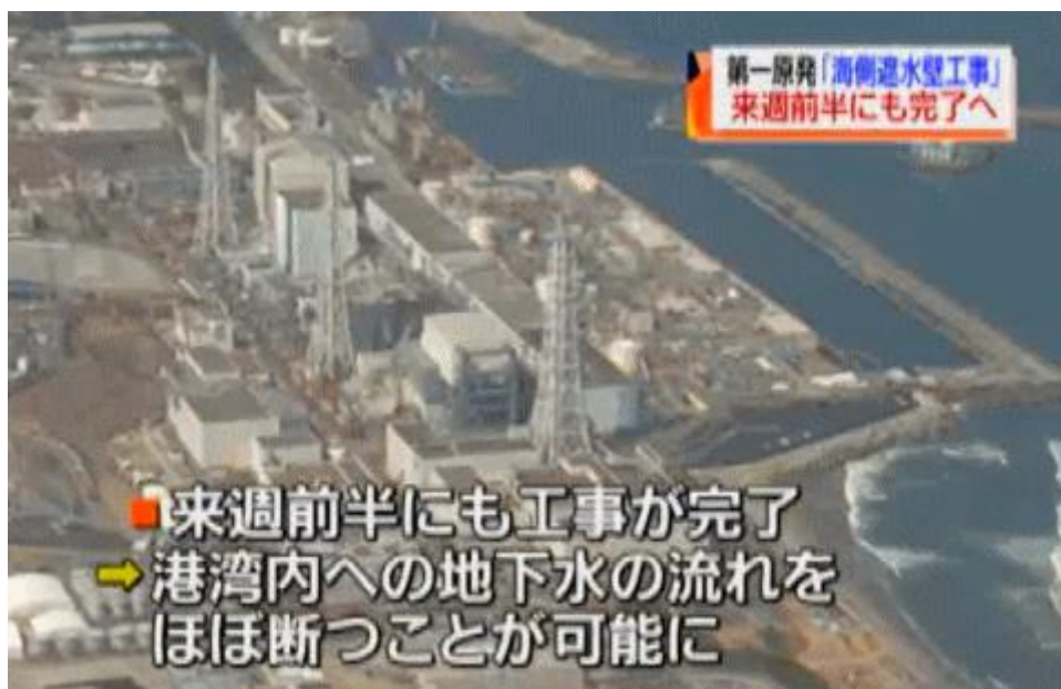
図一2 海側遮水壁が間もなく完成する報じる福島ローカルTV局（FCT）