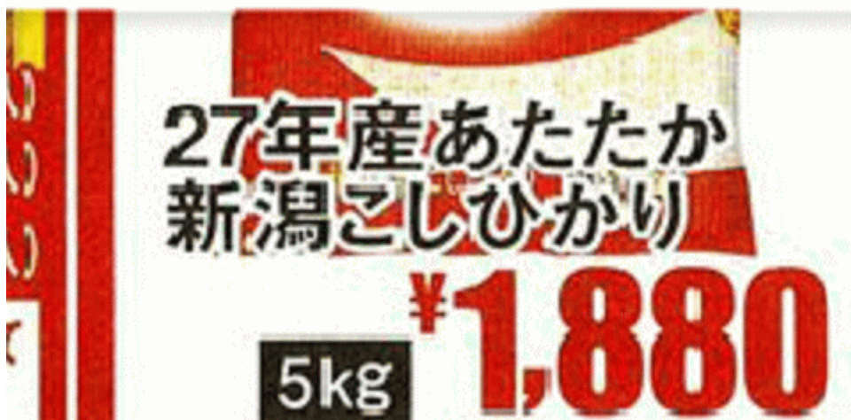
図一5 福島産米が無い福島県*のスーパーのチラシ