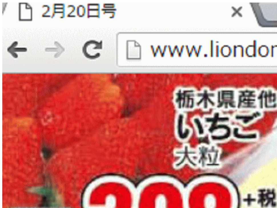
図-13 福島産イチゴが無い福島県伊達市のスーパーのチラシ