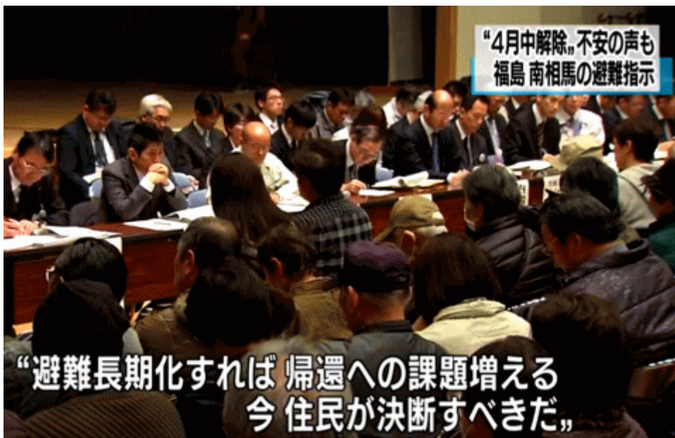
図一 1 2 「避難長期化すれば帰還への課題が増える」と報じる NHK