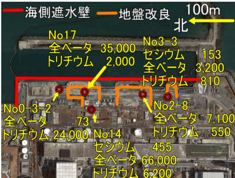
図一七 海岸付近の井戸の放射性物質濃度