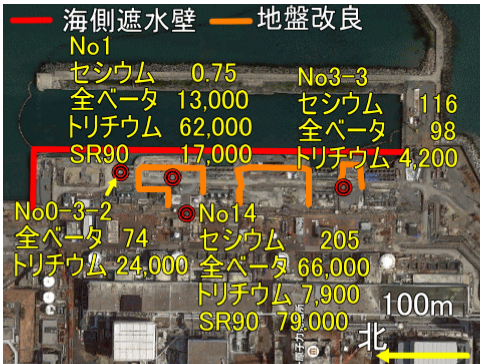
図一 1 1 海岸付近の井戸の放射性物質濃度