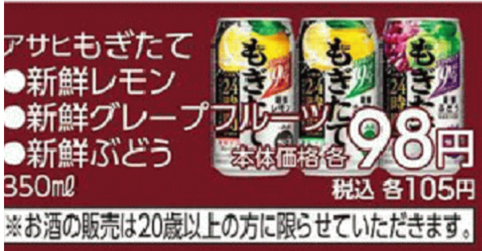
図一 1 3 福島産モモのチューハイが無い福島県郡山市のスーパーのチラシ