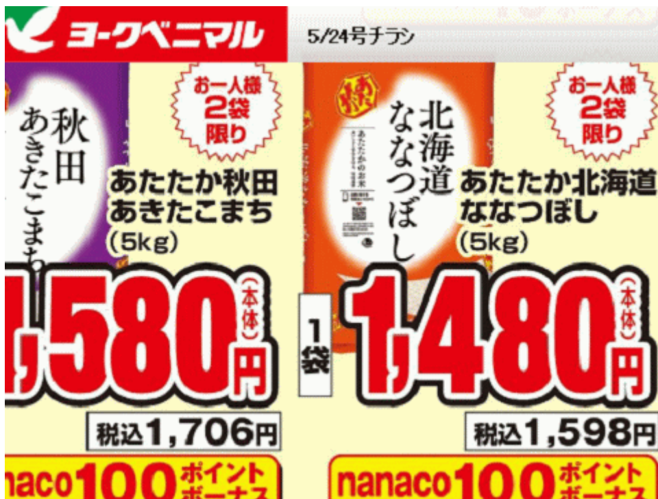
図ー6 福島産米が無い福島県郡山市のスーパーのチラシ