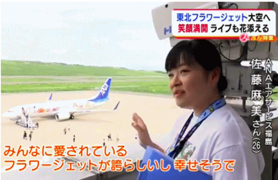
図一4 福島空港に飛来したフラワージェットと福島の綺麗な女性