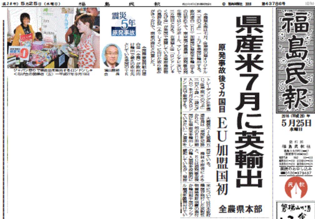
図ー5 福島産米のイギリス輸出決定を伝える福島県の地方紙・福島民報